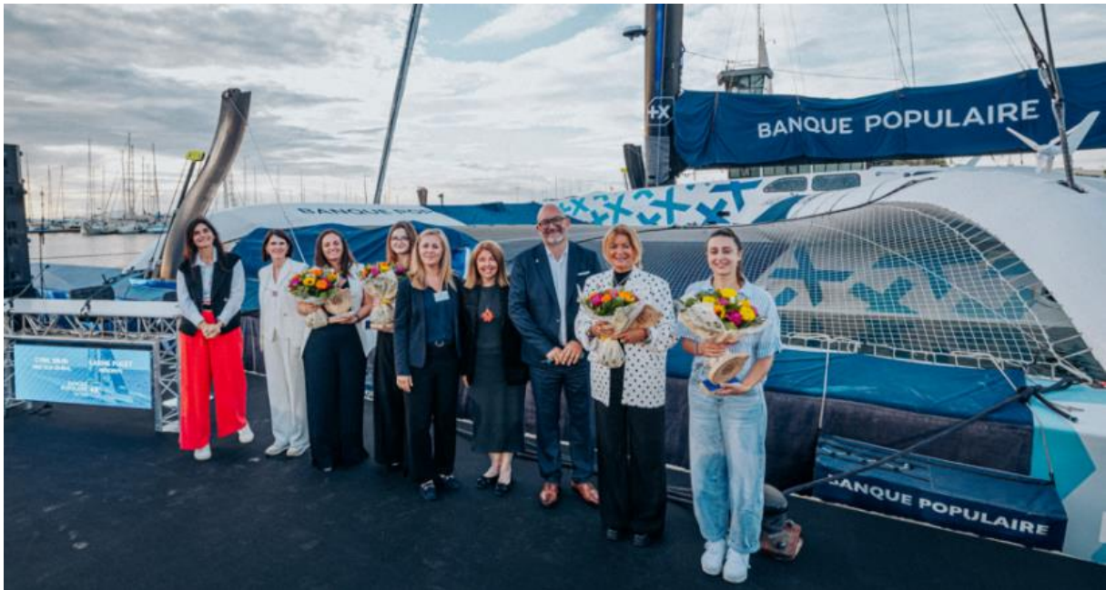
Les lauréates du Prix Sud Exceptionn'elles 2026 et leur remettant

À travers cette séquence, la Banque Populaire du Sud, première banque des entreprises pour la 16 ème année consécutive, a réaffirmé son rôle de partenaire de celles et ceux qui entreprennent, et plus particulièrement de celles qui, souvent, restent encore trop peu visibles.